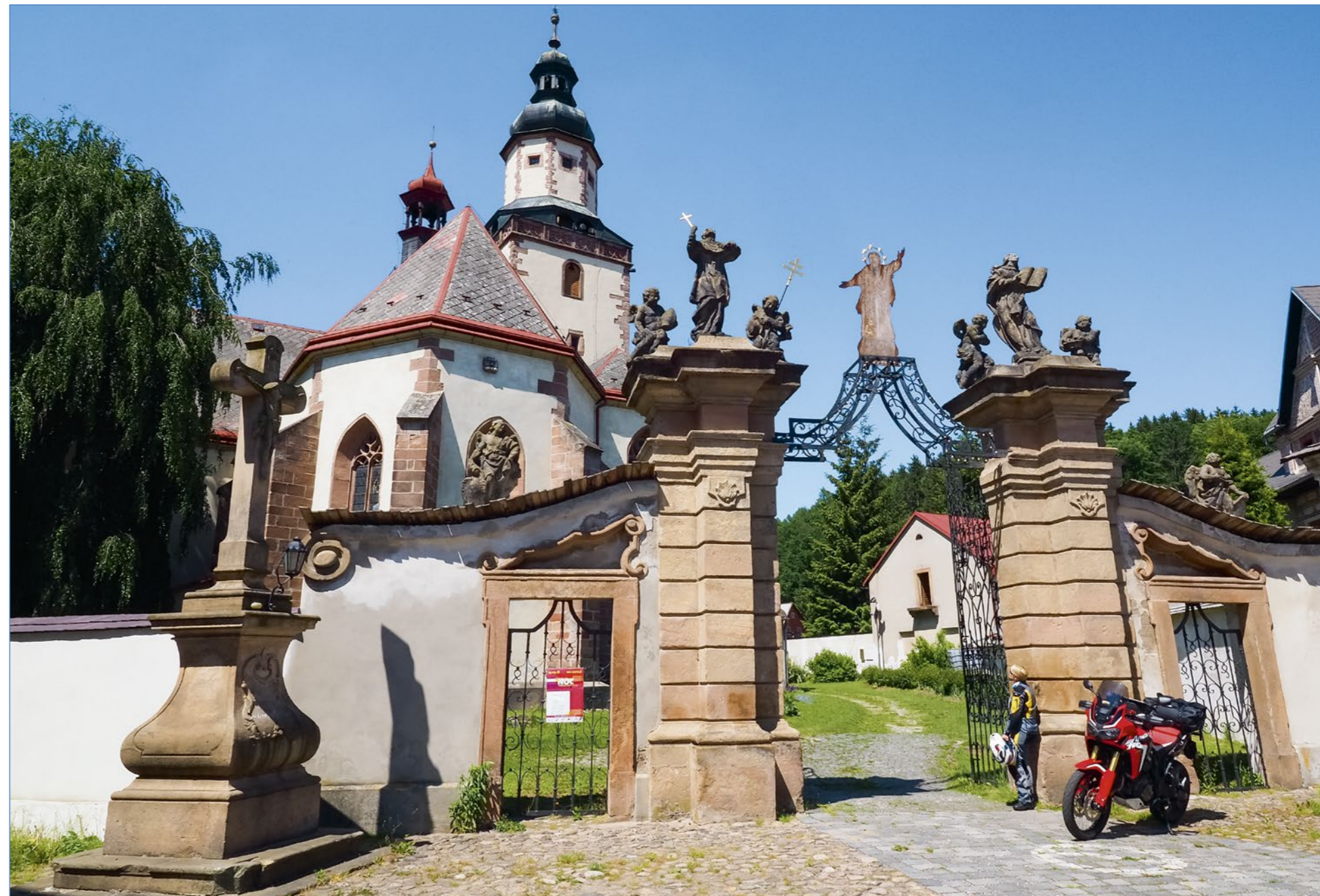
Stilles Kloster: kunstvoll verziertes Eingangportal der Dreifaltigkeitskirche von Hostinné (l.). Grenzenlos: Auf dem Weg von Hřensko nach Bad Schandau öffnet sich der Blick auf das Elbsandstein- gebirge (g. l. o.). Märchenhaft: Direkt am Elbe-Radweg liegt die Talsperre Nila Tremesan mit ihren markanten Brücken- türmen (g. l. u.).

WER EIN WENIG KULTURINTERESSE NEBEN DEM GASGRIFF BAUMELN HAT, WIRD HIER WUNDERSCHÖNE MOTIVE ENTDECKEN