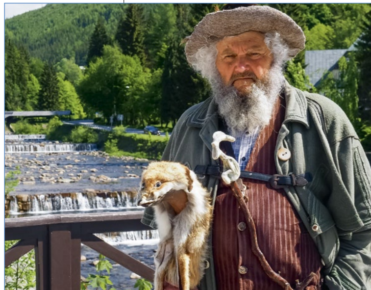
Schrulliger Schrat: Berggeist Rübezahl – Herr des Riesengebirges und immer noch verliebt in die Elbe.

Mann und Frau ... Ach, sei nicht traurig und kehr' zurück zu den nebligen Hochmooren der Elbwiesen. Aber lass den Quatsch mit den Touristenfotos hier unten an der weißen Elbbrücke in Spindlermühle. Du bist schon viel zu alt, um Tag und Nacht neben dem Fluss herzulaufen.«