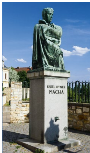
Denker und Dichter: Der romantische Lyriker Karel Hynek Mácha wurde nur 26 Jahre alt und starb in Litoměřice.

NICHTS UND NIEMAND KANN SIE NUNMEHR BEZWINGEN