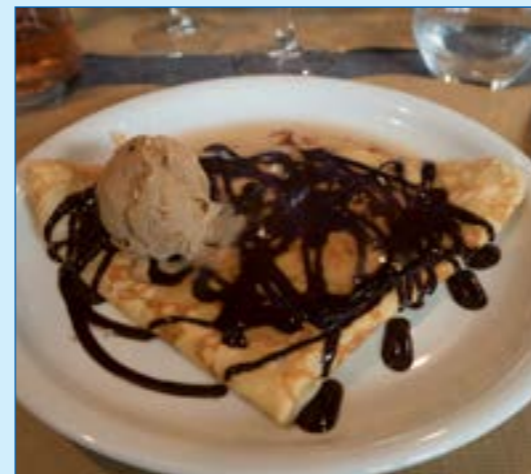
Kölich-süße Versuchung: flambierter Crêpe Irlandaise im »La Crêp'« von Quiberon.

widerstehen vermag und das Frühstück selbstverständlich im Hause einnehmen möchte. Meine Frau ist glücklich, die CRFs sind glücklich und über den »Marais Salants« (Salzwiesen) der Halbinsel Guérande beginnt es zu tröpfeln. Das nenne ich Timing!