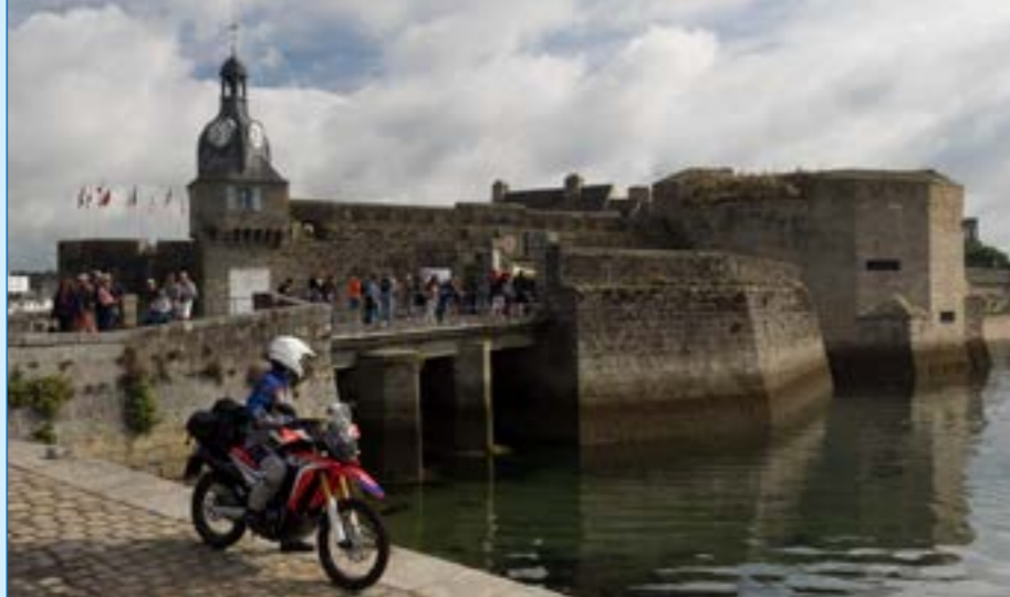
Uneinnehmbar: Die Altstadt von Concarneau ist eine befestigte »Ville Close«.

sich zur Aufgabe gemacht, genau diesen Prozess aufzubereiten. Obwohl seine Maltechnik durchaus Anhänger findet, sieht sich Gauguin nach einem Bruch der Freundschaft mit Vincent van Gogh bald isoliert, zieht wegen finanzieller Probleme ins benachbarte Le Pouldu und kehrt seiner Wahlheimat 1891 schließlich vollends den Rücken. In Polynesien glaubt er haben, und es entstehen jene Bilder von Tahiti-Mädchen und -Motiven, die man an humanistischen Gymnasien zu gern als Interpretationsvorlage vorgesetzt bekommt. Gauguin hat Pont-Aven übrigens nur einmal wiedergesehen, bevor er in der Südsee gesellschaftlich völlig abstürzt und nach Alkohol-Exzessen und schwerer Syphiliserkrankung 1903 elendig zugrunde geht.